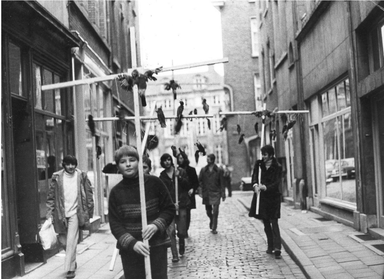
Leden van de BJN voeren actie tegen de illegale vogelvangst. Waar de vereniging zich aanvankelijk hoofdzakelijk richtte op natuurbeleving, surfte ze nadien nadrukkelijk mee op de protestgolven van de jaren 1960 en 1970.

planten en nestkasten ophangen. Tijdens de jaren 1960 en 1970 ging de BJN zich in toenemende mate richten op natuurbescherming. Ze protesteerde tegen de legale en later illegale vogelvangst, tegen olievervuiling op zee, zwerfvuil en wegwerpverpakkingen, maar ook tegen hogervermelde infrastructuurprojecten als de A24.