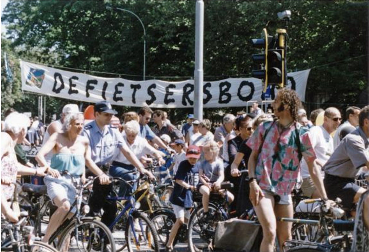
De Fietsersbond voert actie voor een fietsvriendelijkere stad Antwerpen, 19 mei 1998. Duurzame mobiliteit nam vanaf de jaren 1990 een steeds prominere plek in binnen de milieubeweging.

Vanaf het einde van de jaren 1980 kreeg het echter een centralere plaats in het ecologische denken – ook in Vlaanderen. Campagnes over energieverbruik, afvalreductie, biologische landbouw en veranderende mobiliteit brachten het ecologische ideaal dichterbij het dagelijkse leven van burgers.