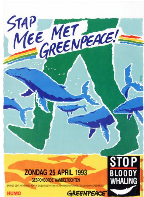
De Belgische afdeling van Greenpeace voert actie tegen walvisvangst, 1993. Internationale milieubewegingen kregen tijdens de jaren 1980 en 1990 steeds meer voet aan de grond in België en introduceerden vraagstukken die de onmiddellijke nationale context overstegen. (af006080, Amsab-ISG).

Ook binnen het netwerk van Friends of the Earth kreeg België een vaste plaats. In Wallonië was sinds 1976 een Franstalige afdeling actief onder de naam Les Amis de la Terre , opgericht door onder anderen Paul Lannoye, die zijn ecologisch engagement combineerde met een politiek mandaat voor de groene partij. In 2004 werd ook de organisatie Voor Moeder Aarde opgenomen in dit netwerk en herdoopt tot Friends of the Earth Vlaanderen & Brussel .