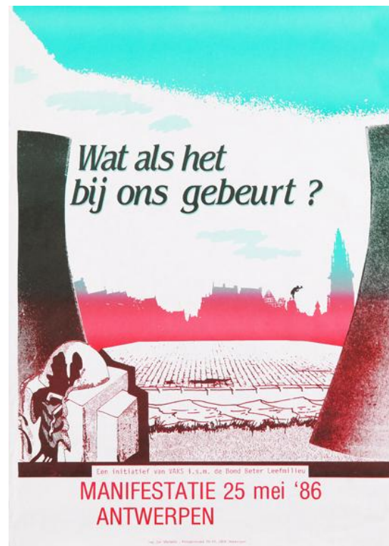
Affiche tegen kernenergie uit 1986. De ramp in de centrale van Tsjernobyl gaf nieuw momentum aan de antikernenergiebeweging (af010217, Amsab-ISG).

in mindere mate ook vakbonden en kritische academici betrokken. Voor de BBL werd het debat al snel existentieel. De koepel zat gewrongen tussen verenigingen als VAKS die fel tegen kernenergie ageerden en steunende leden uit de bedrijfswereld die tot het andere kamp behoorden.