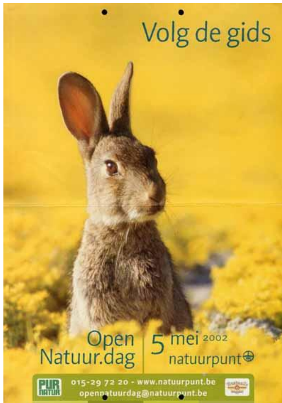
Affiche voor de Open Natuurdag van 2002. De vorming één jaar eerder van Natuurpunt uit de fusie van De Wielewaal en Natuurreservaten zorgde voor een belangrijke consolidatie binnen de Vlaamse natuurbescherming (af006010, Amsab-ISG).

Specifiek op het vlak van bosbescherming kregen De Wielewaal en de BNVR in 1970 het gezelschap van de Vlaamse Bosbouwvereniging (VBV) , die als doel had de bosoppervlakte in Vlaanderen te verhogen. Het VBV wilde daartoe een draagvlak creëren met acties als de Week van het Bos (vanaf 1979) en een noodlijn waar burgers illegale boskap konden melden (1988). In 2012 smolt het VBV (dat intussen door het leven ging als de Vereniging voor Bos in Vlaanderen ) samen met Groenhart , een zustervereniging gericht op tropische bossen, tot BOS+ , zelf een personele unie van BOS+ Vlaanderen en BOS+ Tropen. In 1983 werd tevens Kritisch Bosbeheer Vlaanderen (KBV)