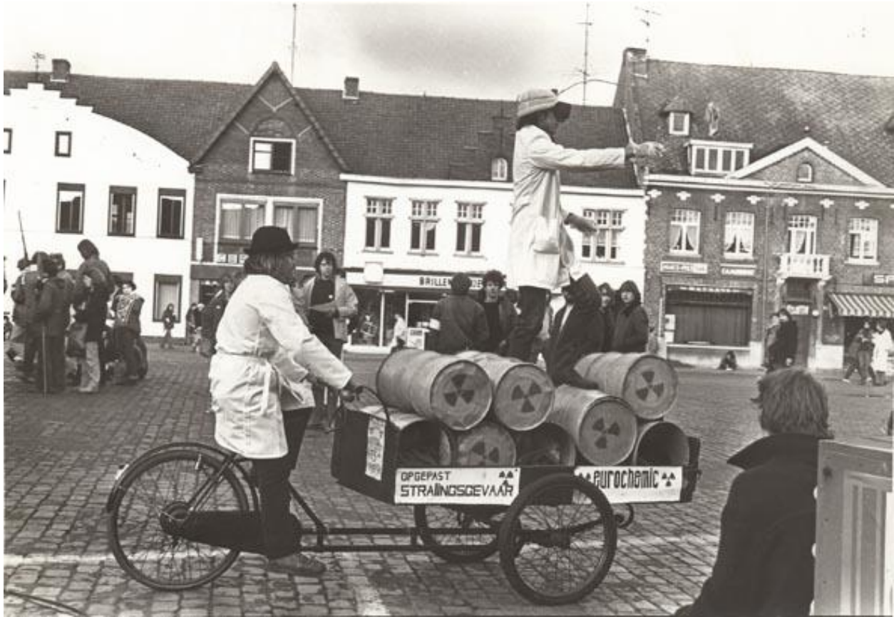
VAKS protesteert tegen kernenergie in Mol in oktober 1980. Wat aanvankelijk begon als lokaal verzet tegen de bouw van een nieuwe kerncentrale in Zeebrugge, groeide uit tot een nationaal gedragen protest (fo021054, Amsab-ISG).

De genuanceerde positie die BBL uiteindelijk innam, kon geen enkele partij bekoren en zorgde voor het opdrogen van belangrijke financiële middelen.