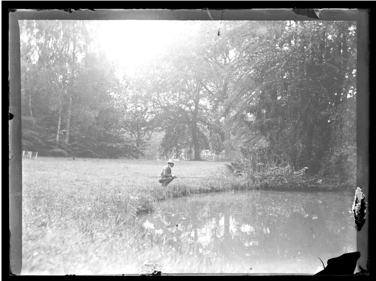
Hengelaarsverenigingen waren een van de eerste actiegroepen die in België ijverden voor een schoner leefmilieu, in de eerste plaats de waterlopen waar hun leden hun hobby uitoefenden. (Glasnegatief uit de collectie Lateur, Amsab-ISG).

Zoniënwood. In 1909 ging de vereniging over in de (vandaag nog steeds bestaande) Ligue des Amis de la Forêt de Soignes . Omstreeks gelijktijdig werd in Antwerpen de Koninklijke Vereniging voor Natuur- en Stedschoon (KVNS) opgericht, die daarom vaak als Vlaamse tegenhanger van de Zoniënwoodvereniging wordt gezien. De KVNS streed voor het behoud van de Kalmthoutse Heide, maar zou – onder meer via haar lokale afdelingen – ook andere landschappen proberen te beschermen zoals de Leiestreek, de Kust en de Kempen. Heel wat van haar leden hadden een kunstenaarsachtergrond. In transnationale navolging van de school van