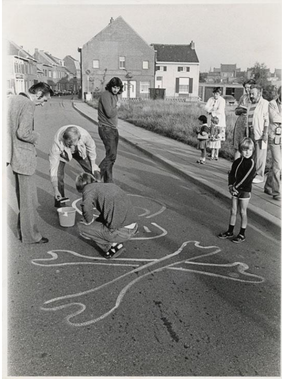
De Groene Fietsers van Boom voeren actie voor een meer op fietsers gerichte infrastructuur © Luc Peeters (fo019501, Amsab-ISG).

In Gent verzetten de Aktiegroep Bourgoyen-Ossemeersen (ABO) en koepelorganisatie Federatie Milieubescherming Gewest Gent (FMG, later Gents MilieuFront) zich tegen de vestiging van een waterzuiveringsstation in het gelijknamige natuurgebied, in het naburige Merelbeke protesteerde het Actiecomité Milieubescherming Merelbeke (AMM) tegen de aanleg van een industrieterrein op de site van een bos en nabij Eeklo pleitte het Actiecomité ter Bescherming van het Leen om het militaire domein aldaar te herbestemmen tot een natuurgebied.