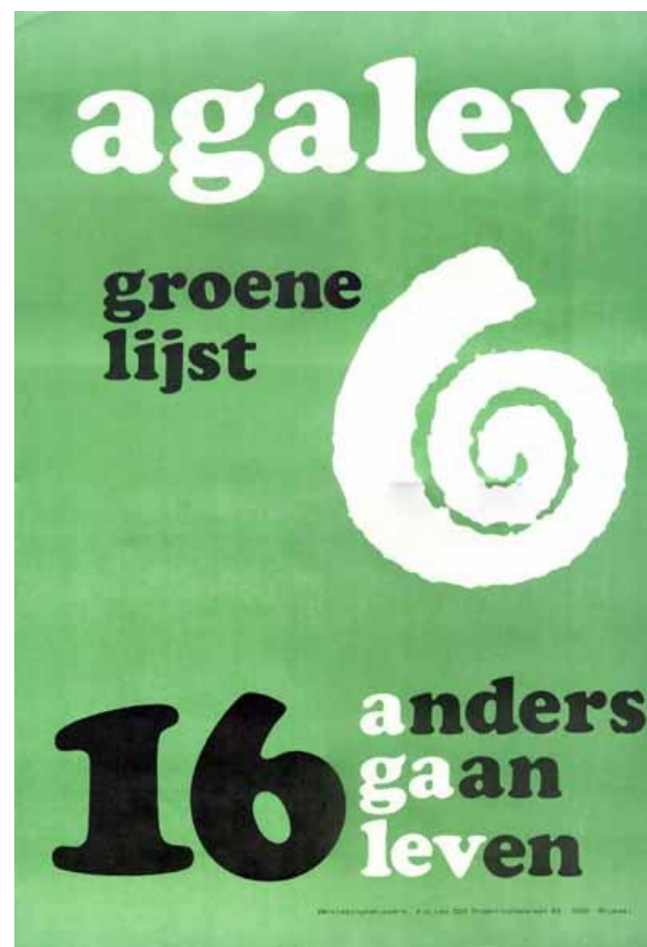
Agalev doet mee aan de gemeenteraadsverkiezingen van 1982 (af017488, Amsab-ISG).

waar het in 1980 opgerichte Ecolo bescheiden politieke successen wist te boeken.