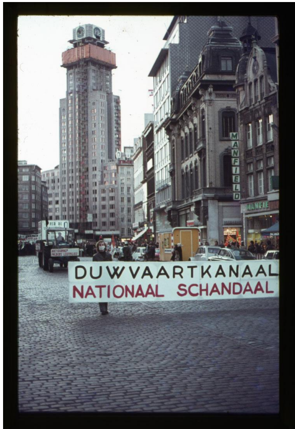
Red de Voorkempen en gelijkgezinde groepen voeren actie tegen het geplande Duwvaartkanaal op een zogenaamde 'Doemeling' in Antwerpen op 2 februari 1974 (fo035845, Amsab-ISG).