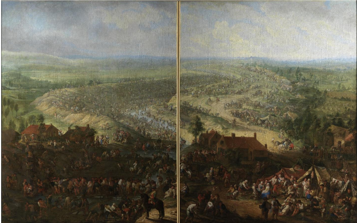
Duizenden arbeiders werken aan het kanaal tussen Gent en Brugge om de waterloop uit te diepen en toegankelijk te maken voor opvarende zeeschepen uit Oostende. De grootschalige werken en dito ingrepen in het landschap staan symbool voor de economische bloei en de prille industriële ontluking van het vroegmoderne België tijdens de tweede helft van de 18e eeuw.

Ontwerp: Jan Garemijn, 1753 (Groeningemuseum Brugge).