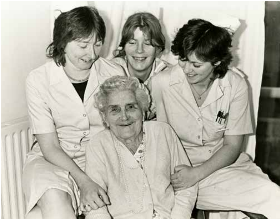
Verpleegkundigen met bewoonster, ca. 1970.

200 en 300.000 Belgische frank op zes weken. Dat was de moeite waard op dat ogenblik, dit was iets uniek.' In 1979 oordeelt De Vriendenkring dat het kraam een te zware last is. De vereniging vervangt het tombola-kraam door een zomertombola (tot 2001) en verpacht de standplaats op de foor, tot het stadsbestuur de plaats in 2016 afschaft. 53