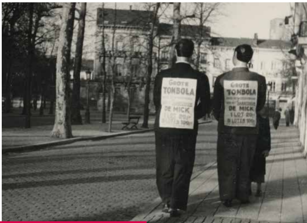
Reuzenommegang voor een steun-tombola voor de wederopbouw van De Mick, 1948.

Sinds eind jaren 1950 worden bijna alle acties gecoördineerd en georganiseerd in het kader van de vzw Vriendenkring van De Mick, die in het Antwerpse een netwerk van lokale afdelingen heeft. De vereniging heeft op zijn hoogtepunt meer dan een dozijn afdelingen met meer dan zesduizend leden, heeft duizenden showavonden en allerlei soorten acties op haar naam staan en draagt miljoenen euro's bij aan de werking van De Mick. Het is De Vriendenkring