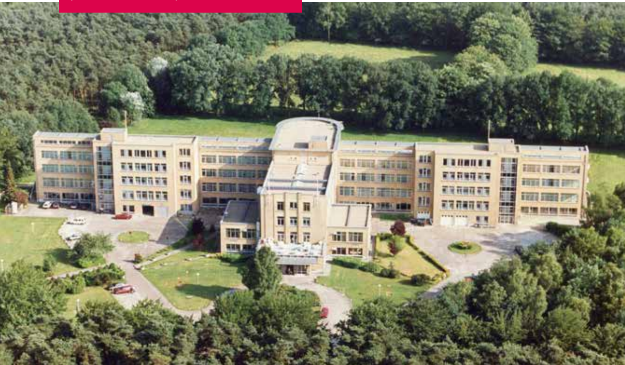
Sanatorium De Mick na de heropbouw in 1953, voorkant, zicht op de hoofdingang. (Fotoarchief De Mick)