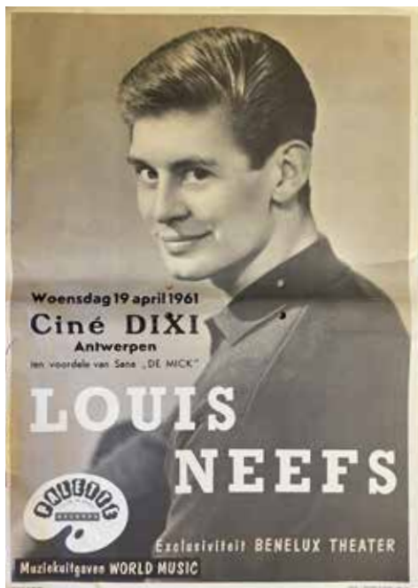
Affiche met uitnodiging voor een showavond met Louis Neefs, 1961.