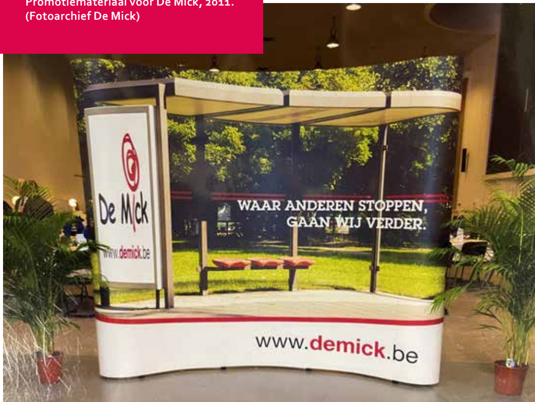
Promotiemateriaal voor De Mick, 2011.

diensten) en levert de eerste directeur van het nieuwe gefusioneerde ziekenhuis. De directe aanleiding zijn de budgettaire donkere wolken rond nieuwe Vlaamse bevoegdheden en accreditatieprocedures, maar op de achtergrond sluimert natuurlijk al lang de strategische vraag: waarheen moet het met een klein, afgelegen, gespecialiseerd ziekenhuis? 16