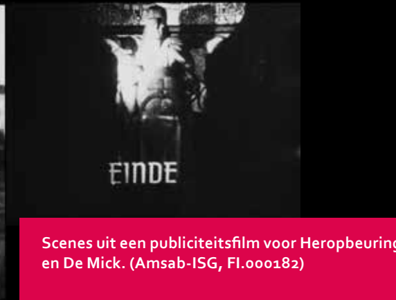
Scenes uit een publiciteitsfilm voor Heropbeuring en De Mick. (Amsab-ISG, FI.000182)