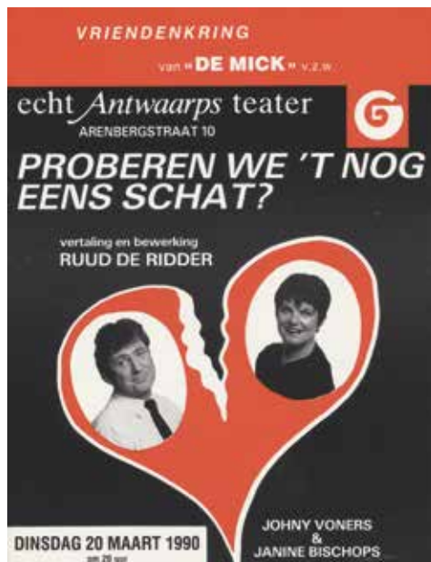
Brochure van een toneelvoorstelling van het Echt Antwaarps Teater, 1990.