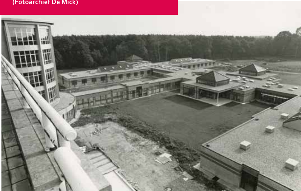
De Mick, het woonzorgcentrum in opbouw, 1994.