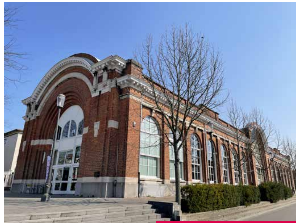
Feestzaal Kielpark.