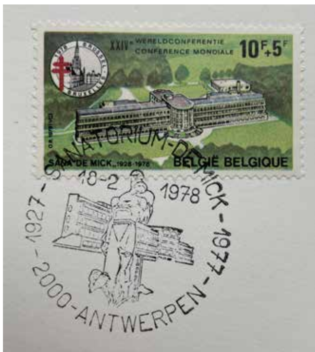
Postzegel uitgegeven naar aanleiding van de viering van 50 jaar De Mick, 1978.