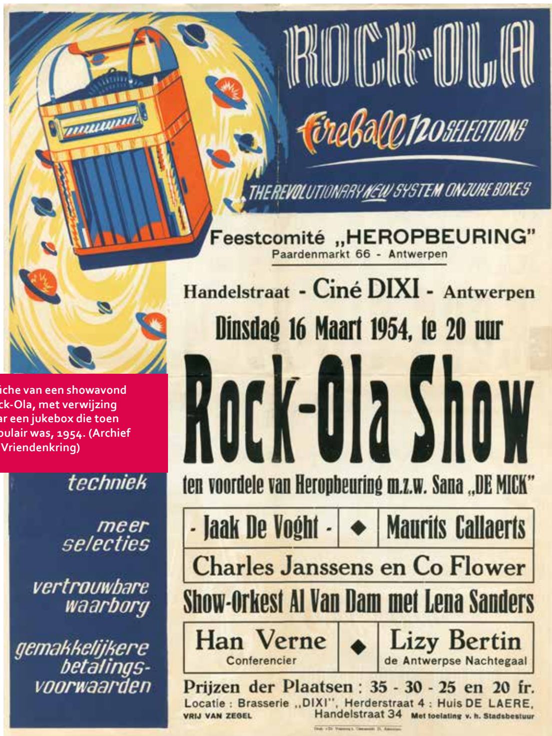
Affiche van een showavond Rock-Ola, met verwijzing naar een jukebox die toen populair was, 1954.