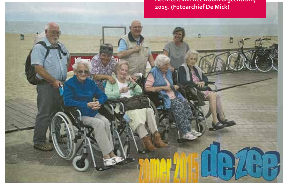
Activiteit van het woonzorgcentrum, 2015.

ker. In 1980 wordt de zogenaamde oefentuin geopend. In een stukje bos naast de parking worden allerlei wandelpaden en houten oefentuigen gebouwd, zodat de patiënten hun oefeningen in openlucht kunnen doen. Die natuurbeleving in de zorg is revolutionair. Maar ze is haar tijd te ver vooruit en er is nauwelijks personeel beschikbaar om de oefeningen buitenshuis te begeleiden. Bij de verbouwing in de jaren 1990 krijgen de kine- en ergodiensten nieuwe lokalen op de vierde verdieping en raakt de oefentuin in onbruik. Anno 2022 zijn er plannen om de tuin in zijn oude glorie te herstellen met een speelzone in een natuurlijke omgeving. 42