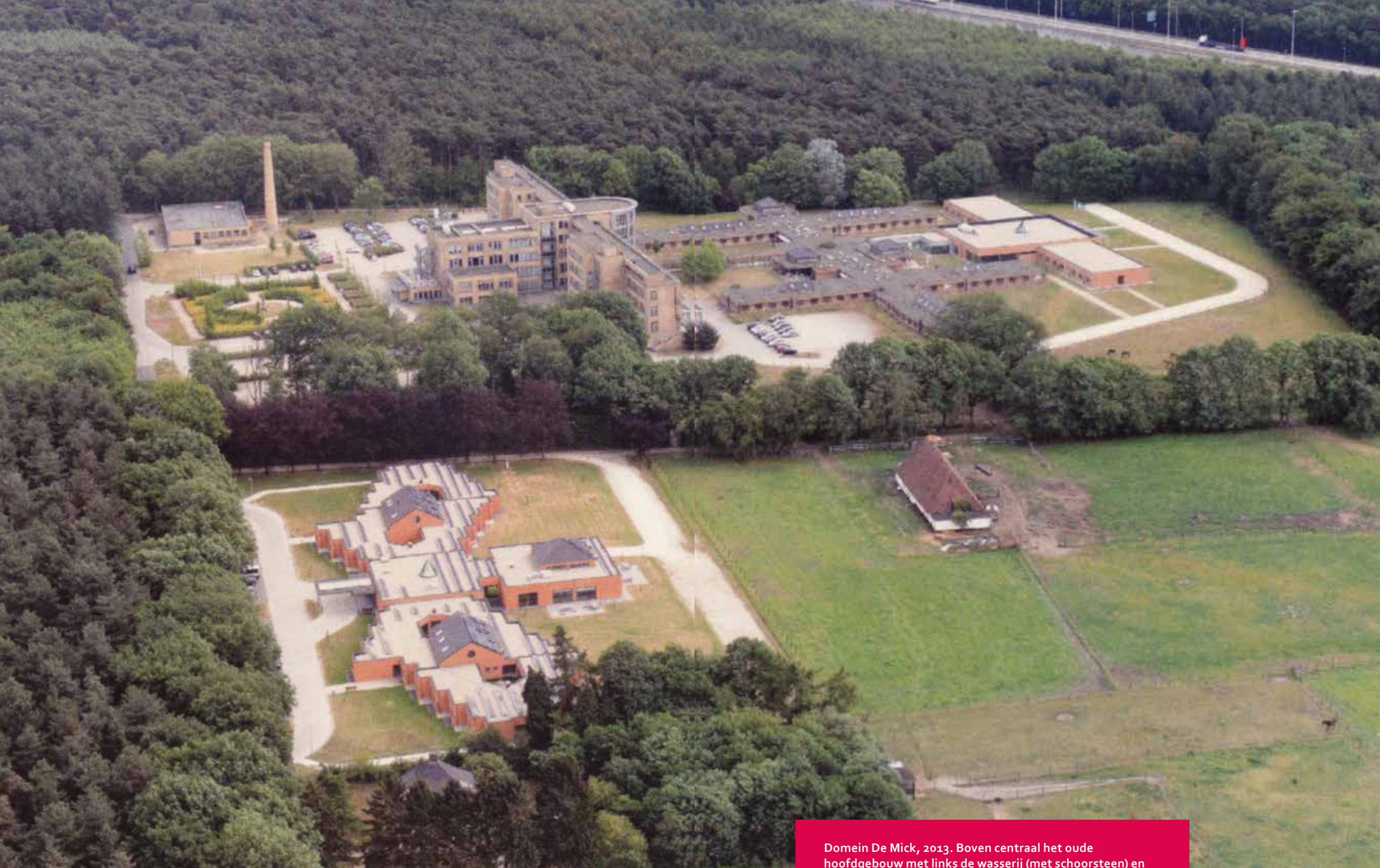
Domein De Mick, 2013. Boven centraal het oude hoofdgebouw met links de wasserij (met schoorsteen) en rechts het woonzorgcentrum met zijn verschillende vleugels (uiterst rechts, vleugel Conscience uit 2010). Onder links De Vrije Vlinder in de vorm van een vlinder, het centrum voor MS-patiënten, en rechts de oude Mickhoeve.