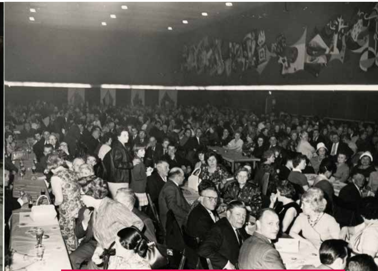
Een showavond van De Vriendenkring in de jaren 1960 trok een publiek van honderden.