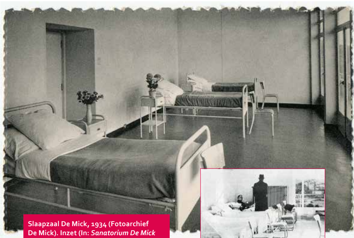
Slaapzaal De Mick, 1934. Inzet (In: Sanatorium De Mick Brasschaat , 1935, p. 12).