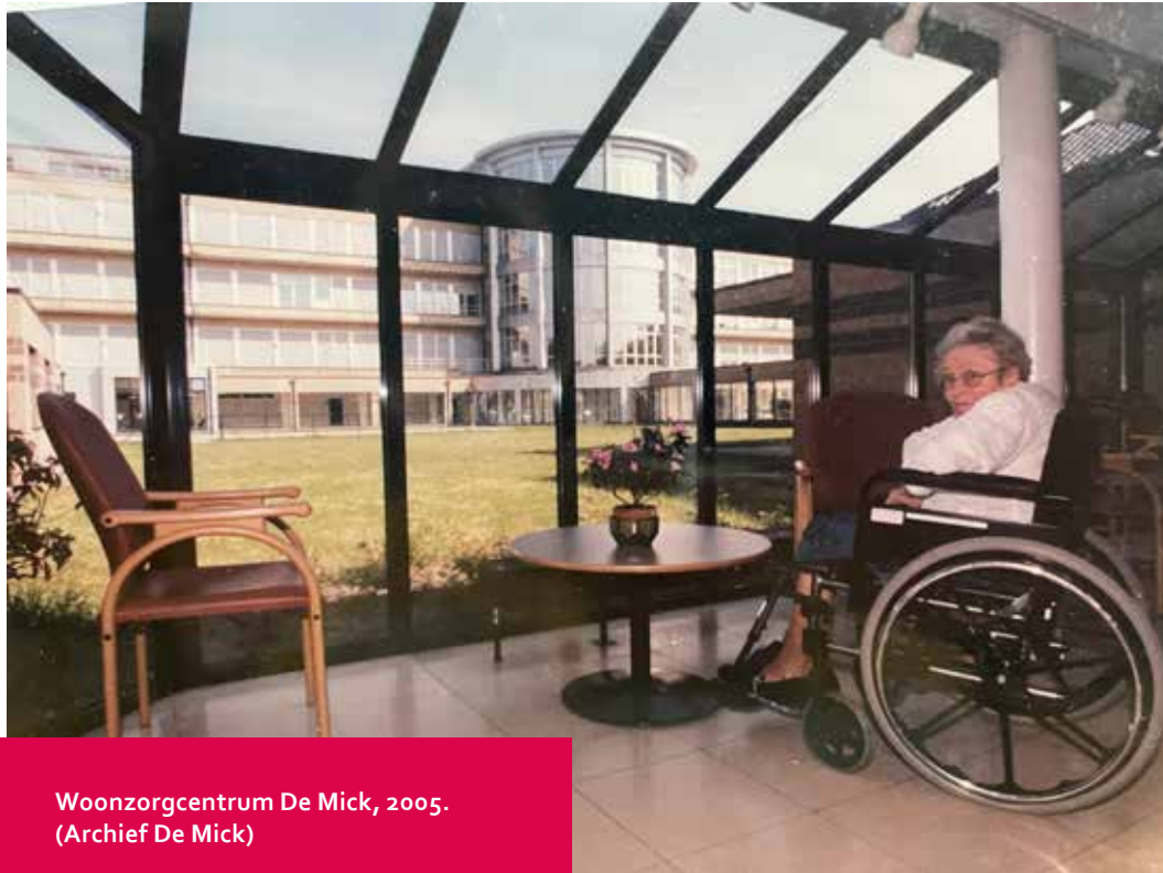
Woonzorgcentrum De Mick, 2005.