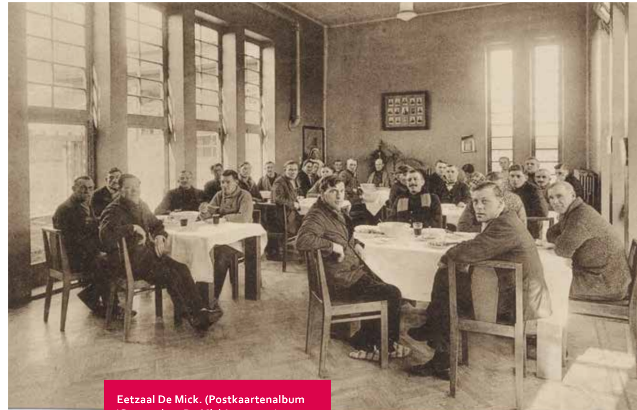
Eetzaal De Mick. (Postkaartenalbum 'Sanatorium De Mick', ca. 1927)

Het middelpunt van het sanatorium is de gezellig ingerichte verenigingszaal. Daar is een bibliotheek met 150 boeken: 'De zieken kunnen daar spelen, schrijven, lezen en zich vermeien in de opgewekte tonen van een pianola en luisteren naar de concerten en het grote wereldnieuws