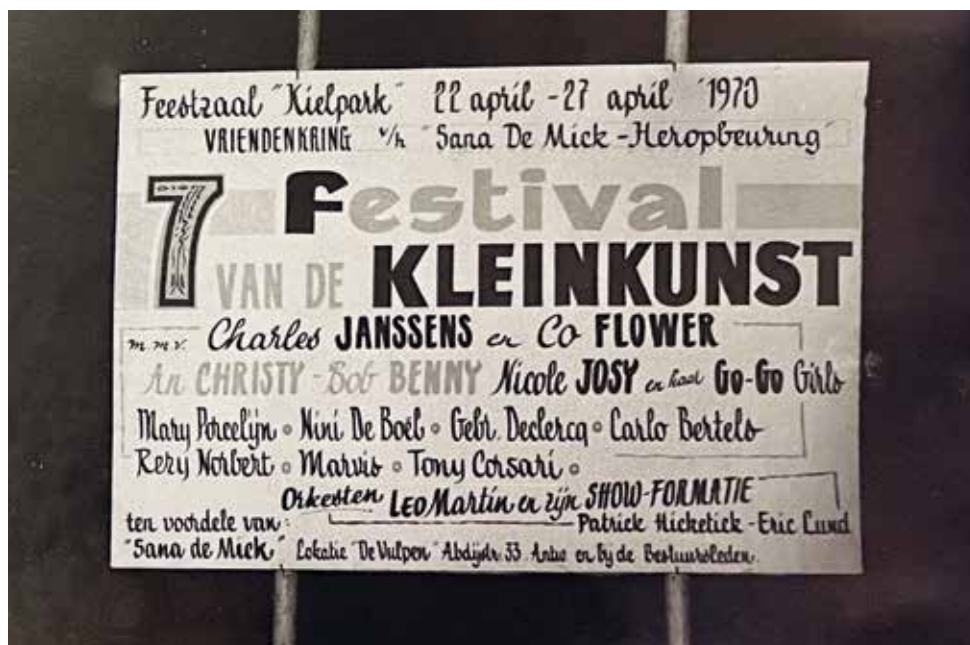
Aankondigingsbord aan de feestzaal met de artiesten die zullen optreden op het Kleinkunsthof, 1970. (Archief De Vriendenkring)

dag voorbehouden. De grote feestzaal in het Kielpark heeft meer dan vierhonderd plaatsen en een dansvloer. Voor wie de muziek moe is, is er een bierkelder en een bodega. Om nog meer geld in het laatje te brengen, organiseert de vereniging tijdens het festival een tombola. En alsof dat nog niet volstaat, serveert ze vanaf 1977 ook eten. Op zaterdagavond is er een gastronomisch buffet, met eerst alleen koud, later ook met warm eten. Aanvankelijk verzorgen de voortreffelijke chef-kok van het sanatorium en zijn keukenpersoneel het buffet, maar dat blijkt toch een te zware last. Bovendien gaat het om oneerlijke con-