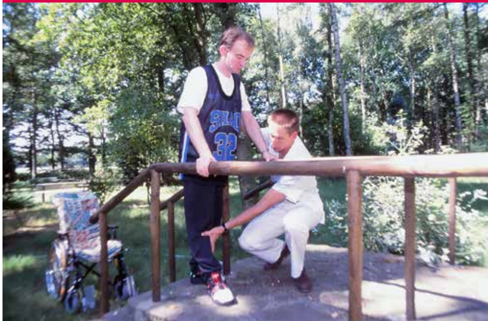
Oefentuin van De Mick, 1995.