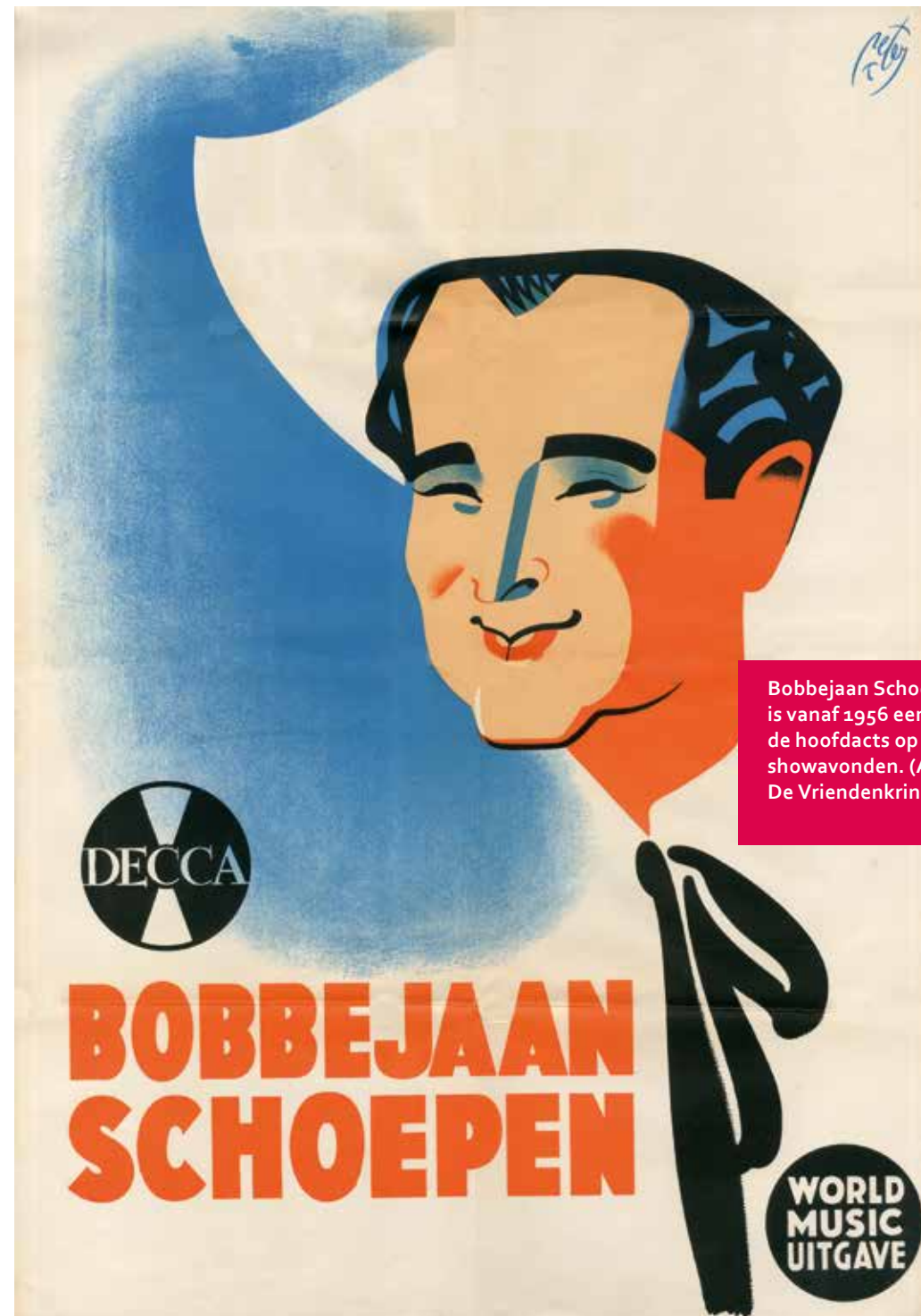
Bobbejaan Schoepen is vanaf 1956 een van de hoofdacts op de showavonden.