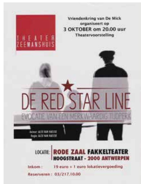
Affiche voor een toneelvoorstelling over de Red Star Line die emigranten vanuit de Antwerpse haven naar de USA bracht, 2013.

kan de kermisganger tombolalotjes kopen, die regelmatig verloot worden en leuke prijzen opleveren. Met die activiteit bereikt De Vriendenkring verreweg haar grootste publiek. Jarenlang brengt het kermiskraam ook het meeste op. De medewerkers van de BTB en De Mick zullen de Sinksenfoor in elk geval nooit vergeten: iedere medewerker die in de jaren 1960 en 1970 begint, krijgt een aantal dagen corvee op de foer en moet in het kraam gaan staan. We laten Fons Geeraerts aan het woord, begin jaren 1960 nog een jonge BTB-bediende: 'Als je op de Paardenmarkt werkt moet je mee lotjes verkopen. Minstens twee, drie keren tijdens de foer, minder dan vijf keren moest je