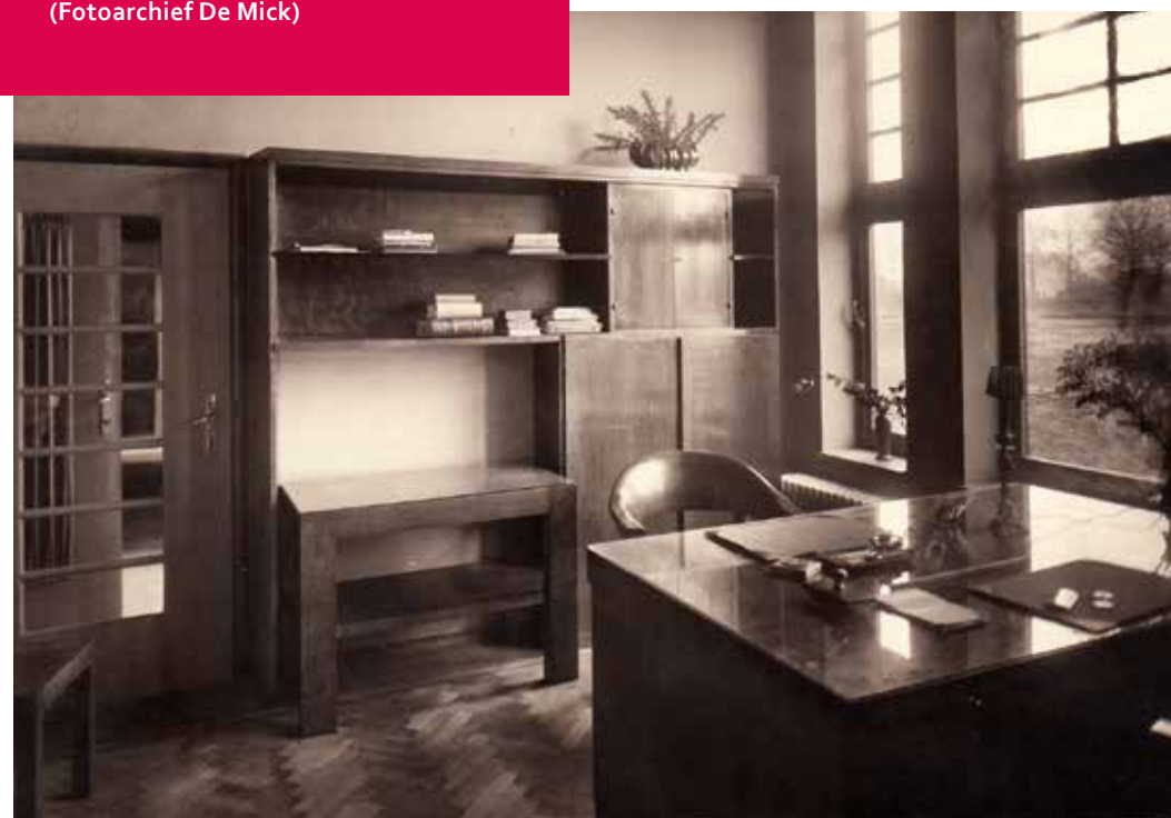
Bureau van de directeur in De Mick, 1927.

torium in Borgoumont bij Luik. Voor de arme gezinnen uit het Antwerpse is het onbegonnen werk om hun zieke familieleden te bezoeken. De reis duurt uren en een treinkaartje kost geld. De zieken 'teren' weg, eenzaam en geïsoleerd, in het verre Franstalige Luik. De vzw was gelukkig zo vooruitziend om in de statuten op te nemen dat ze 'alle onroerende en roerende goederen [zal] mogen bezitten [...] hetzij in vruchtgebruik, hetzij in eigendom'. Heropbeuring gaat dus op zoek naar een eigen plek voor 'teringlijders'. 4