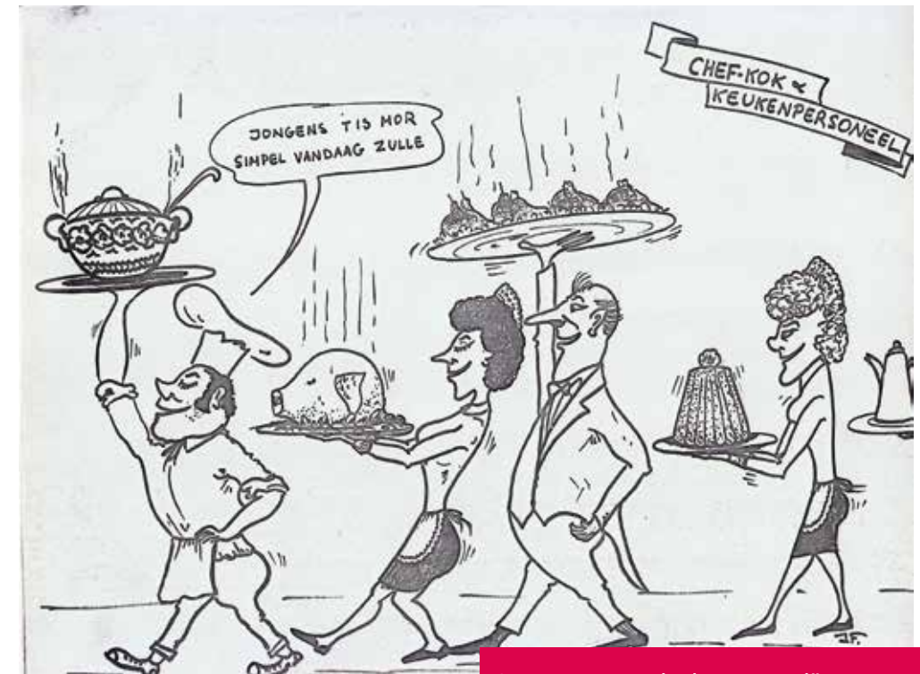
Spotprent gemaakt door een patiënt van De Mick voor het kerstfeest van 1970.

In de jaren 1950 en het begin van de jaren 1960 blijft het leven in De Mick zijn gang gaan. Maar er tikt een tijdbom onder de sanatoria. Een Antwerpse dokter deelt in 1962 zijn bezorgdheid: 'In 1953 [...] is het sana-