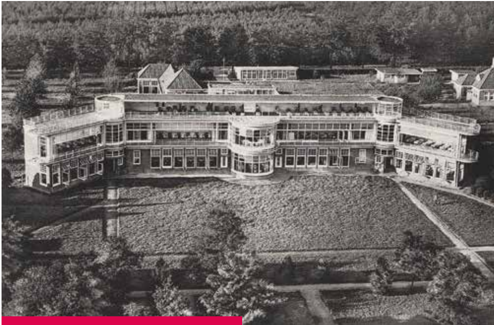
De Mick na de uitbreiding van 1934.

BTB-medewerkers stuiten op een groen domein met weiden en bossen in Brasschaat op 15 kilometer van het Antwerpse centrum, in een gebied dat van oudsher de Mick wordt genoemd. Een deel van de grond blijkt eigendom te zijn van de stad Antwerpen, van wat dan nog het Bureel van Weldadigheid heet. Vanaf 1 oktober 1923 huurt Heropbeuring er 20 hectare, een uitgebreid domein waarop nog een oude middeleeuwse hoeve staat, bekend als de Mickhoeve. Aanvankelijk bouwt de vzw er enkele lighallen om zieken toe te laten van de natuur te komen genieten. Vrijwel meteen dringt door dat dat niet volstaat en dat Heropbeuring een eigen sanatorium moet bouwen. Eind 1925 is het Bureel van Weldadig-