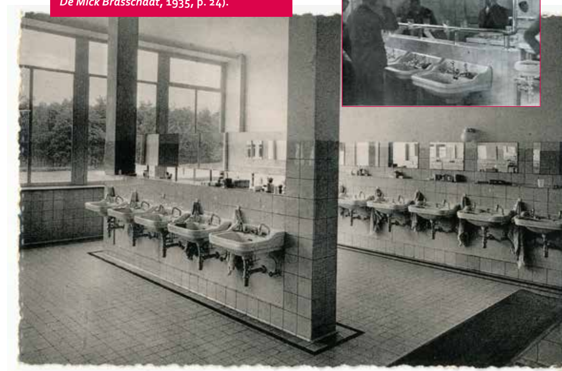
Waslokaal met lavabo's in De Mick. Inzet (In: Sanatorium De Mick Brasschaat, 1935, p. 24).